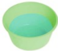
kom lauw water