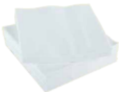
keukenrol of witte servietten